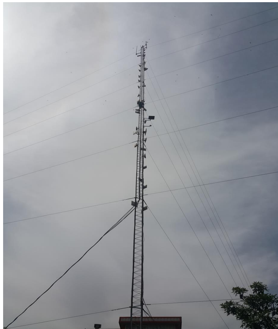
راه اندازی ارتباطات بی سیم و تجهیزات رادیویی